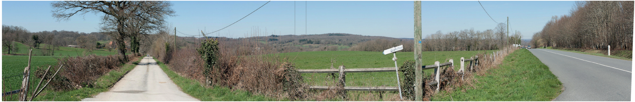
Photosimulation 26 : Bonnat