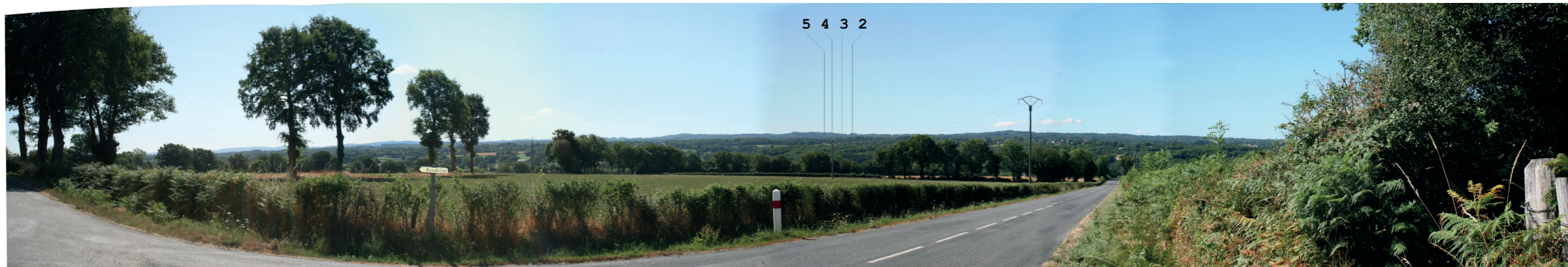
Photosimulation 27 : RD15