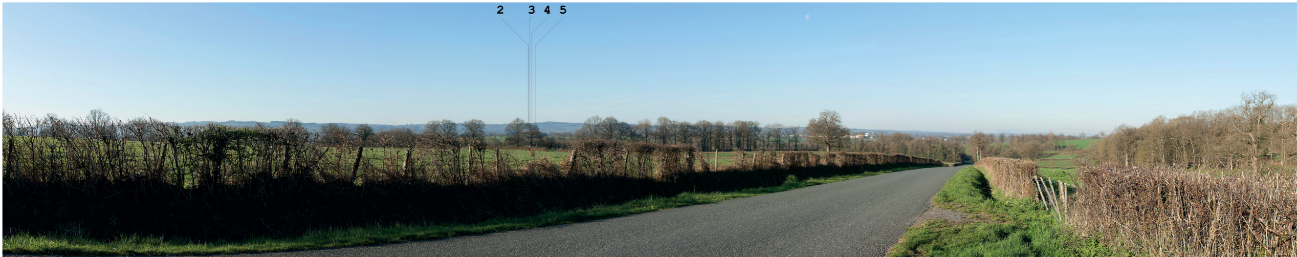
Photosimulation 28 : RD940 vers Genouillac